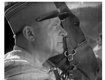
1951 CAPITAINE ARDANT d'André Zwoboda