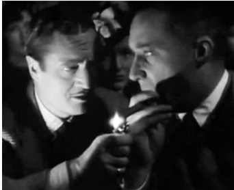
1936 TRAFFIC D'ARMES (Seven Sinners) d'Albert de Courville avec Edmund Lowe