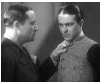
1932 FANTÔMAS de Paul Fejos avec Georges Rigaud