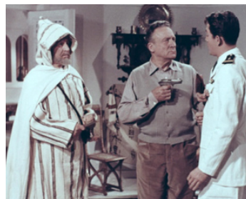
1953 ALERTE AU SUD de Jean Devaivre avec Jean Murat, Jean-Claude Pascal