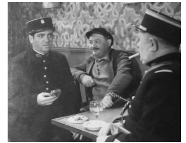
1934 LA MAISON DANS LA DUNE de Pierre Billon avec Raymond Cordy