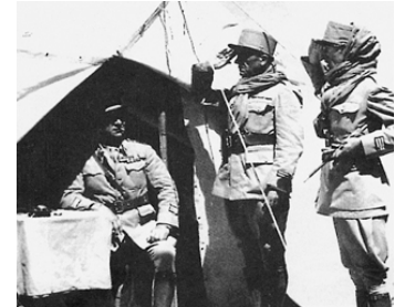
1937 LES HOMMES SANS NOM de Jean Vallée avec Constant Rémy