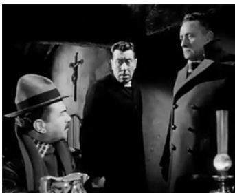
1952 LE RETOUR DE DON CAMILLO de Julien Duvivier avec Gino Cervi, Fernandel