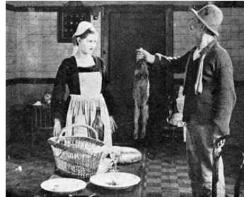
1925 LES DÉVOYÉS d'Henri Vorins avec Marguerite Madys