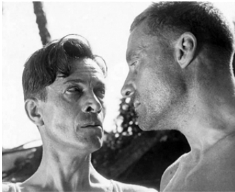
1928 LA DIVINE CROISIÈRE de Julien Duvivier avec Georges Paulais