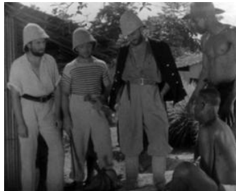
1939 BRAZZA OU L'ÉPOPÉE DU CONGO de Léon Poirier avec Jean Galland