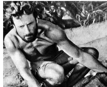
1930 CAÏN, AVENTURES DES MERS EXOTIQUES de Léon Poirier & E. E. Reinert