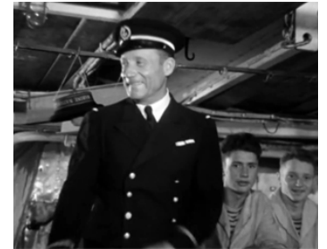
1942 LES CADETS DE L'OcéAN de Jean Drévile