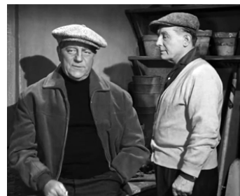
1957 LE ROUGE EST MIS de Gilles Grangier avec Jean Gabin