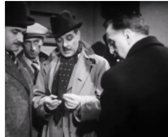
1940 LE COLLIER DE CHANVRE de Léon Mathot avec André Luguet