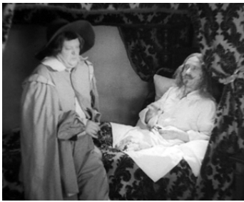
1932 LES TROIS MOUSQUETAIRES d'Henri Diamant-Berger avec Serjus