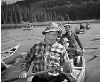
1934 MARIA CHAPDELAINÉ de Julien Duvivier avec Jean Gabin, Charles Blavette