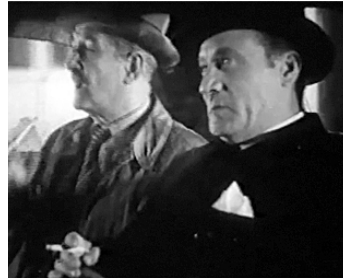
1937 ARSÈNE LUPIN DÉTECTIVE d'Henri Diamant-Berger avec Gabriel Signoret