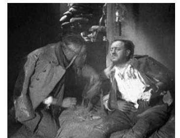
1931 VERDUN, SOUVENIRS D'HISTOIRE de Léon Poirier