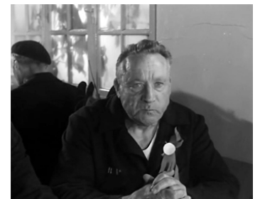
1958 LA TÊTE CONTRE LES MURS de Georges Franju