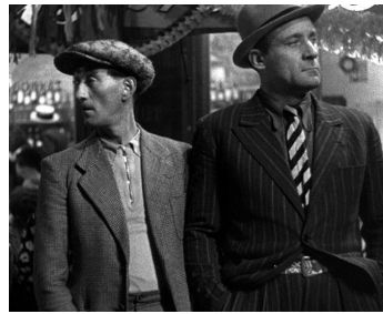
1933 QUATORZE JUILLET de René Clair avec Raymond Aimos