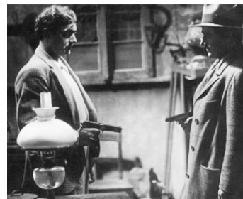
1931 TUMULTES de Robert Siodmak avec Charles Boyer