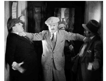
1930 SOUS LES TOITS DE PARIS de René Clair avec Gaston Modot