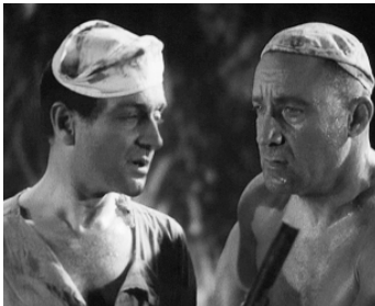
1938 CHÉRI-BIBI de Léon Mathot avec Pierre Fresnay