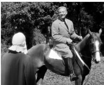
1943 JEANNOU de Léon Poirier avec Saturnin Fabre