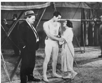
1931 À MI-CHEMIN DU CIEL d'Alberto Cavalcanti avec Enrique Rivero, Janine Merrey